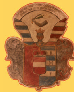
▲ Renesanční křídlo. Erb Czerninů z Chudenic v interiéru zámku. ▼ Hlavní zámecká budova.

Městys Chudenice se snaží zámek postupně rekonstruovat a co největší část zpřístupnit veřejnosti. V rámci projektu s názvem „Rozšíření expozic a výstavba sociálního zázemí Starého zámku v Chudenicích“, jehož realizaci finančně podpořil ROP NUTS II Jihozápad, městys v roce 2014 rozšířením stávajících expozic zprovoznil nový prohlídkový okruh a vybudoval potřebné sociální zázemí pro návštěvníky. Na nádvoří byl obnoven dřevěný přístřešek pro nové venkovní expozice zemědělské a hasičské techniky. Díky tomu vznikla kvalitnější infrastruktura pro návštěvníky a došlo k celkovému posílení konkurenceschopnosti této památky, obce i celého Chudenicicka.